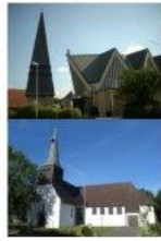
St. Maria St. Martin