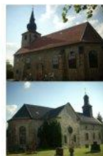
St. Pankratius St. Andreas