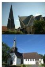
St. Maria St. Martin