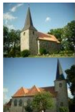
St. Peter und Paul St. Vitus