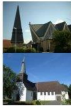
St. Maria St. Martin