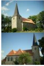
St. Peter und Paul St. Vitus