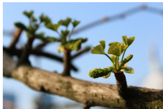
Knospen an einem Zweig

Liebe Gemeinde, so lasst uns voll Vertrauen den ersten Schritt ins neue Jahr tun, aber nicht beim ersten Schritt bleiben.