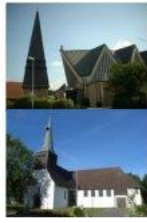
St. Maria St. Martin