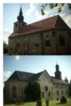
St. Pankratius St. Andreas