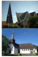
St. Maria St. Martin