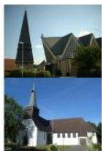
St. Maria St. Martin