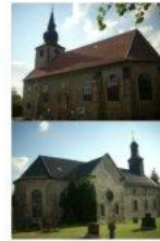
St. Pankratius St. Andreas