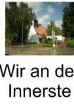
Wir an der Innerste