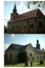
St. Pankratius St. Andreas