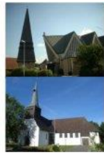
St. Maria St. Martin