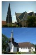
St. Maria St. Martin