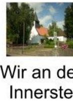
Wir an der Innerste