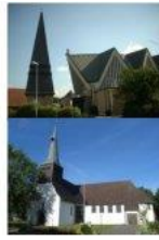
St. Maria St. Martin